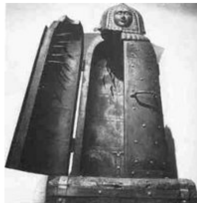
Typy Železné panny