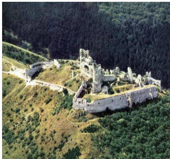
Zřícenina Čachtického hradu