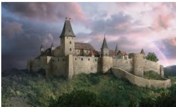
Modelová simulace původní stavby