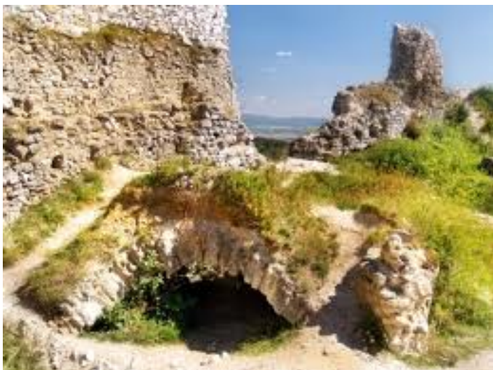
Východ tajné chodby

Mezi Čachtickým hradem a Násadyovským kostelem zvaným Císařský, který dnes už nestojí, dodnes existuje tajná chodba. Systém podzemních labyrintů je 4 km dlouhý a z velké části zasypaný. Protože je v Čachticích tektonická oblast a těží se zde kámen, proto je většina chodeb zasypaná. Avšak vstupy z vnější strany od vesnice a ze vstupů, které vedly z kostela jsou v reálném stavu. Tyto tajné chodby sloužily, jako všude jinde, ke strategickým a bezpečnostním důvodům. V případě ohrožení Turky se mohla šlechta nepozorovaně dostat na jinou část svého panství.