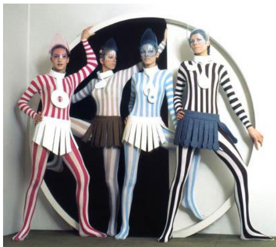
Obr č. 3 Zimní kolekce 1968 .

Halston – Začal experimentovat s límci, na nichž od 60. let vydělával Cardin ohromné jmění