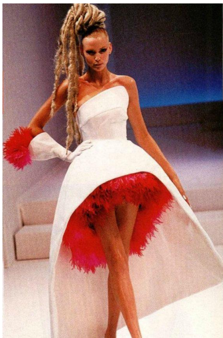
Obr.č. 5 Návrh v roce 1999