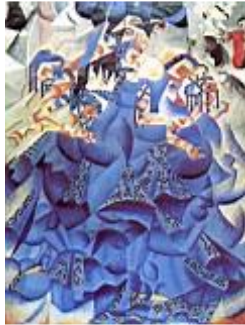
Obr.č.2 Obrázek nazvaný Modrá tanečnice namaloval Gino Severini