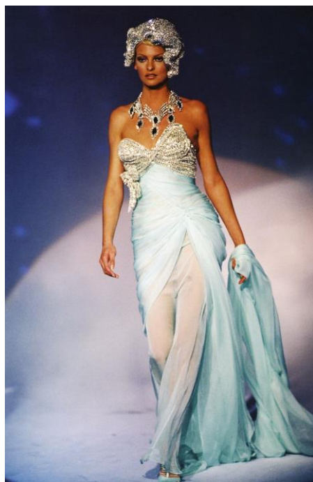
Obr.č.6 Róba 90. let od Muglera