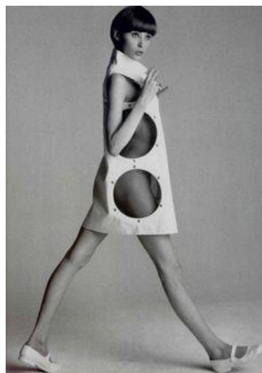
Obr č.4 Návrh v roce 1968