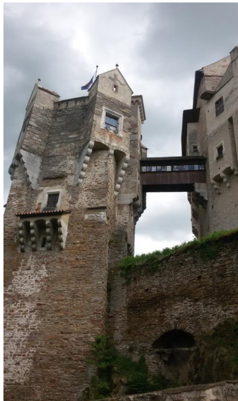
Obr. 4: Hranolová věž s arkýřem