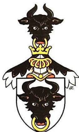
Obr. 1: Znak Pernštejnů

V té době se na podobě hradu nejvíce podepsal syn Viléma Mitrovského Vladimír I., který hrad zrekonstruoval. V roce 1945 Mitrovští o hrad přišli a Pernštejn se stává hradem státním.