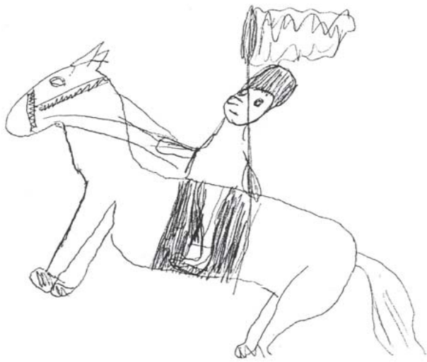
Svatý Václav na bujném oři /Šorruch Šnyrch, VII/