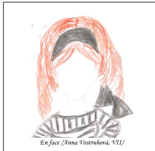
En face /Anna Vostruhová, VII/