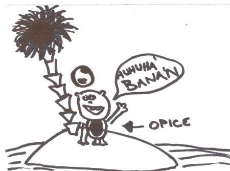
Opice na ostrově /Eva Dostálová, IX/