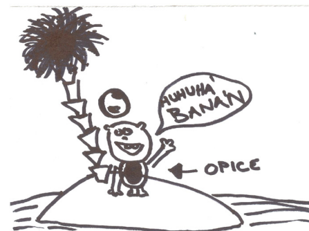
Opice na ostrově /Eva Dostálová, IX/