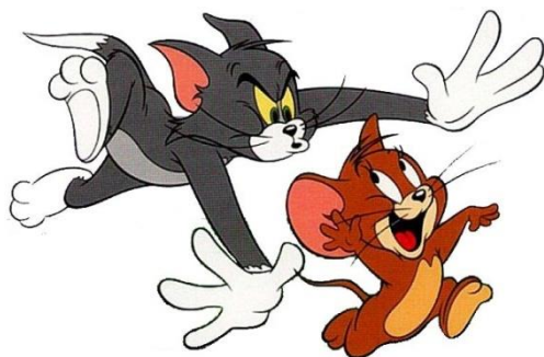
Obr. č. 4 Tom a Jerry