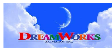
Obr. č. 8 DreamWorks