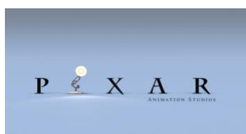
Obr. č. 9 Pixar