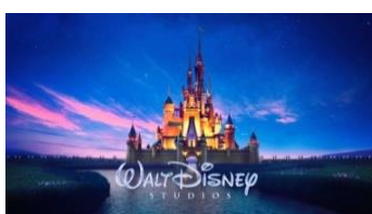
Obr. č. 10 Walt Disney Pictures