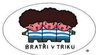
Obr. č. 6 Bratři v triku

BRATŘI V TRIKU – např. večerníček O Kanafáskovi