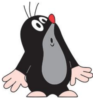
Obr. č. 2 Krteček

Hayao Miyazaki: Princezna Mononoke (r. 1997), Cesta do fantazie (r. 2001)