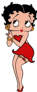
Obr. č. 3 Betty Boop