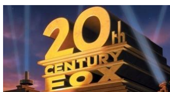
Obr. č. 7 20th Century Fox