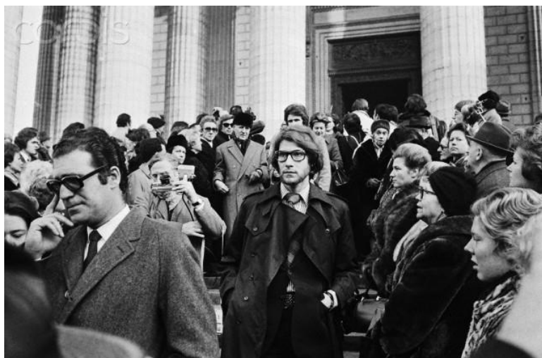
Yves Saint Laurent na pohřbu Gabrielly Chanel.