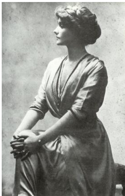
Jedny z prvních fotografií Gabrielly Chanel, kolem roku 1900.