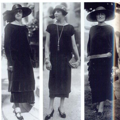
Malé černé šaty.

Malé černé šaty jsou snad nejuniverzálnější kus oblečení. Tyhle šaty by ve svém šatníku měla mít každá žena. Můžete si s nimi vyjít do města, večer si k nim přidáte perlový náhrdelník a slušné boty a rázem můžete jít do divadla. Šaty jsou elegantní a zároveň pohodlné. Vycházejí z jednoduché košilové linie. Nemají vyznačený pas a délku by měli mít po kolena. Malé černé šaty se staly nesmrtelnými. Kromě Gabrielly si je oblíbily i jiné slavné osobnosti.