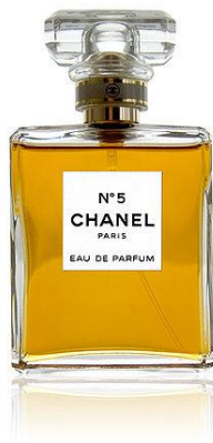
Parfém Chanel No. 5

A proč byl tak slavný její parfém. Zase přišla s něčím novým. Změnila skoro vše. Začala s jménem a skončila s flakónkem. Opojení jednoho večera, Letní vánek, Sladká romance byly názvy, které byly ve 20. Století zvykem. Gabriella přišla s elegantním názvem Chanel No. 5. Co se týče flakónku, byl také jiný. Jak typické pro Gabrielle. Flakónek měl hranatý tvar a na hrdle měl tenkou stužku s logem firmy. Hlavními složkami parfému byli jasmín, růže, vanilka a kosatec. Parfém vyvinul chemik Ernest Beaux.