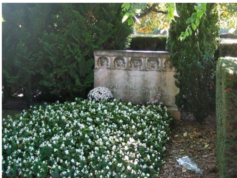
Náhrobek Gabrielly Chanel.

Gabriella zemřela 11. ledna 1971 ve své posteli v hotelu Ritz. Zemře v neděli, v den, který tak nesnášela. Gabriella je pochována na své přání na hřbitově v Lausanne. Ve své závěti všechny své peníze odkazuje své nadaci COGA. Na její místo nastupuje třiceti osmiletý návrhář Karl Lagerfeld.