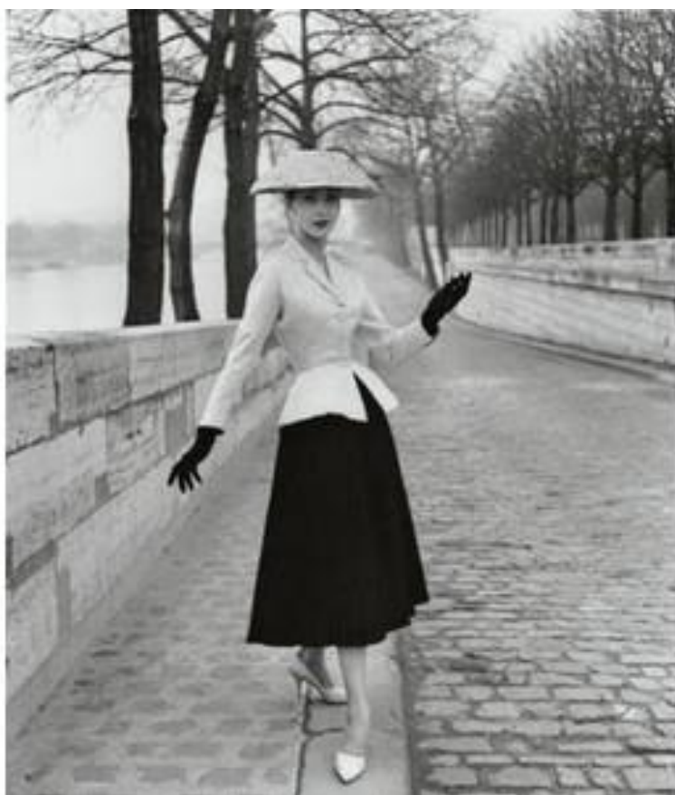
New look od Christiana Diora.

Roky ubíhají, Gabrielle všechny přijdou stejné. V Paříži tráví čím dál více času. Navíc znovu začala navštěvovat divadla a opery. Každý den chodila do přírody. To je možná důvod, proč do konce svých dnů zůstala tak vitální. Začala také znovu sepisovat své paměti, ale znovu bez úspěchu. Copak nemá jiné prostředky, aby dala najevo že je ještě tady?