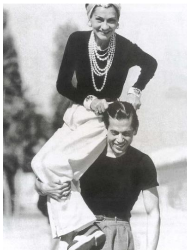
Gabrielle Chanel (54) a Serge Lifar (32), 1937, Venice.