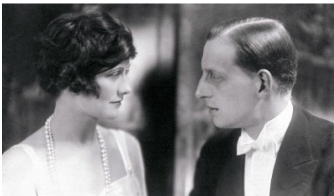
Gabrielle Chanel a Dmitri Pavlovitch.

Gabriellyn vztah s Dimitrem skončil. Gabriella si několik zbývajících let do 2. Světové války „užívala“. Navázala blízké vztahy s mnoha muži. Kamarádila se s mnoha umělci, například s Pabem Picassem. Ten ji pravidelně navštěvoval. Zнала se i s mnoha politiky. Třeba s Winstonem Churchillem. Chodila do společnosti. Dostávala plno zakázek pro divadelní hry, aby šla kostýmy. Měla vztah s velmi bohatým anglickým vévodou s Westminsteru, oficiálním jménem Hugh Richard Arthur, ale přátelé ho znali spíše pod jménem Bennie nebo Bonnie. Jejich poměr trval 5 let. Co se týče obchodů, ty se pořád rozrůstaly. Gabrielle se stávala čím dál více slavnější.