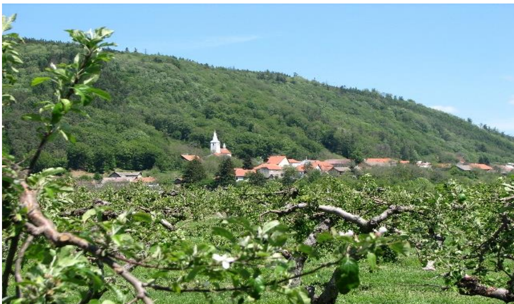
Obr. č. 1. Panorama Podhoří

Polohu hradu Drahotuše však neukazuje městečko Drahotuše (jak by se z názvu mohlo zdát) a které je od Hradu vzdáleno asi 10 kilometrů, ale uděláte lépe, když zahnete při cestě z Lipníku do Hranic a dáte se cestou směrem k Podhoří. Drahotuš se nachází na kopci s nadmořskou výškou 470 m. n. m., 1,5 km severně od Podhoří.