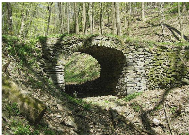
Obr. č. 5 Kamenný most nedaleko hradu Drahotuš

V současné době z hradu již moc nezbylo. Zachovaly se pouze základy a nízké obvodové zdi, ale i přesto si můžete všimnout zvláštní pevnostní architektury, ve které je tento hrad stavěn. Táhlým skalním ostrohem jsou totiž napříč vyhloubeny čtyři příkopy, které oddělovaly jednotlivé části hradu. Drahotuš byl soustavou čtyř samostatných opevněných návrší, které byly pospojovány dřevěnými mosty. K hradu Drahotuš, jenž leží na dlouhé a úzké skalní ostrožně v hřebeni vrcholu Juřacka (589 m) v nadmořské výšce 470 m, se nejlépe můžete dostat po modré turistické značce z Podhoří. Strmá pěšina, po které se v teplejším období roku pohybuje i velké množství cykloturistů, vede přímo k hradu. Cestou zajisté budete míjet kamenný most, který byl postaven o mnoho později než samotný hrad. Ten tu lidé postavili asi v 17. století, když odváželi kameny z Drahotuše na stavby svých domů a cest.