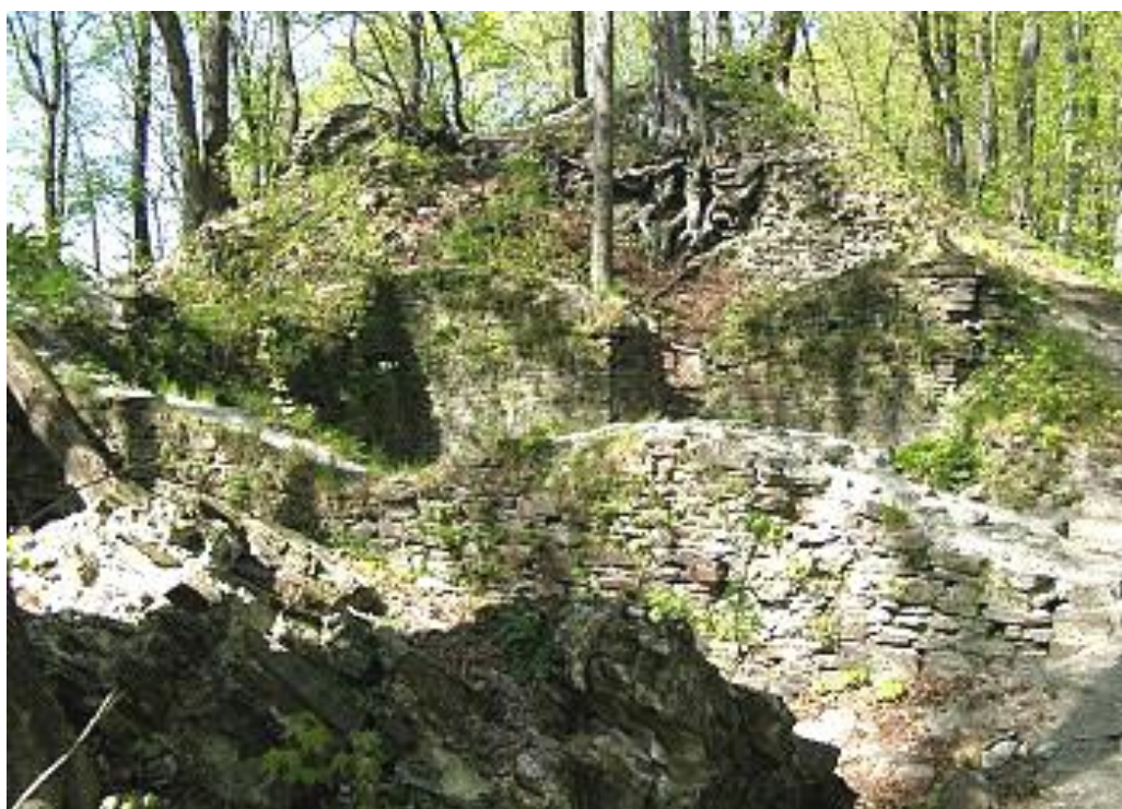
Obr. č. 7 Místo kde původně stála hlavní věž