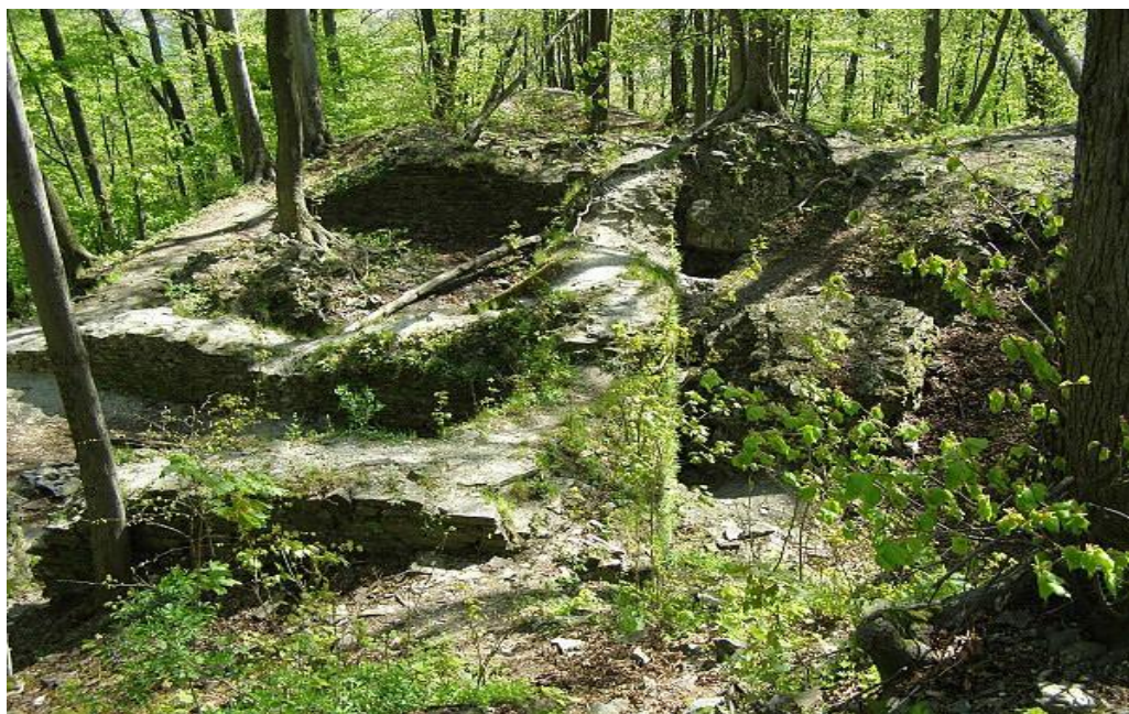
Obr. č. 6 Obvodové zdi hradu Drahotuše