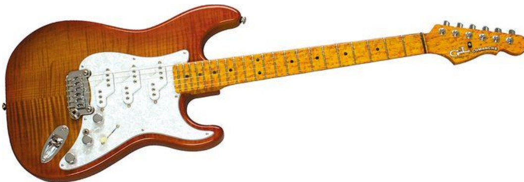
Obr. 7 G&L Comanche