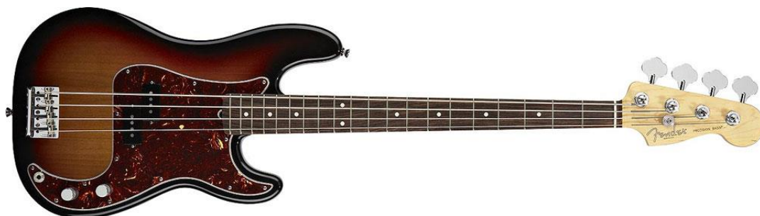
Obr. 3 Precision Bass

Zajímavostí Precision Bass guitar je specifická chromovaná krytka přes snímač, která mohla sloužit jako opěrka pro ruku kytaristy a jejím účelem bylo i ochránit snímač před zvuky z okolí a dosáhnout tak lepšího tónu. Tato krytka se na kytaru přidělávala až do 80. let, později se od toho upustilo.