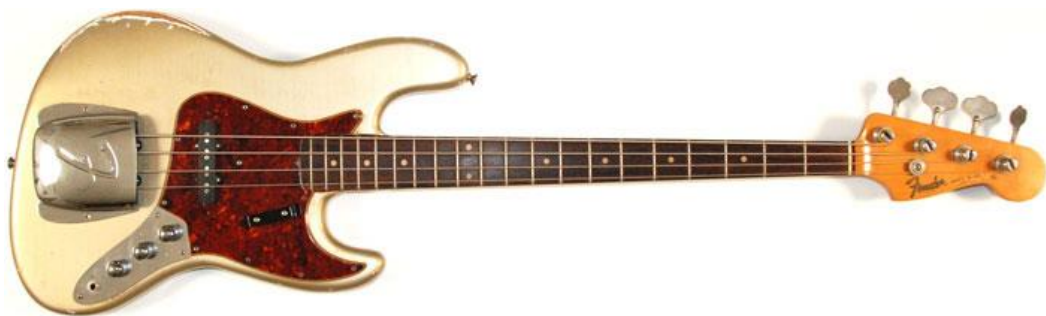
Obr. 5 Jazz Bass

Protože nějakou dobu trvalo, než si basová kytara Fender Precision získala hudebníky zvyklé na akustický kontrabas, objevil se další model Fenderu, Jazz Model na trhu až v roce 1960. Basová kytara Jazz Bass poskytovala širší škálu zvuků a měla přesněji dělený krk.