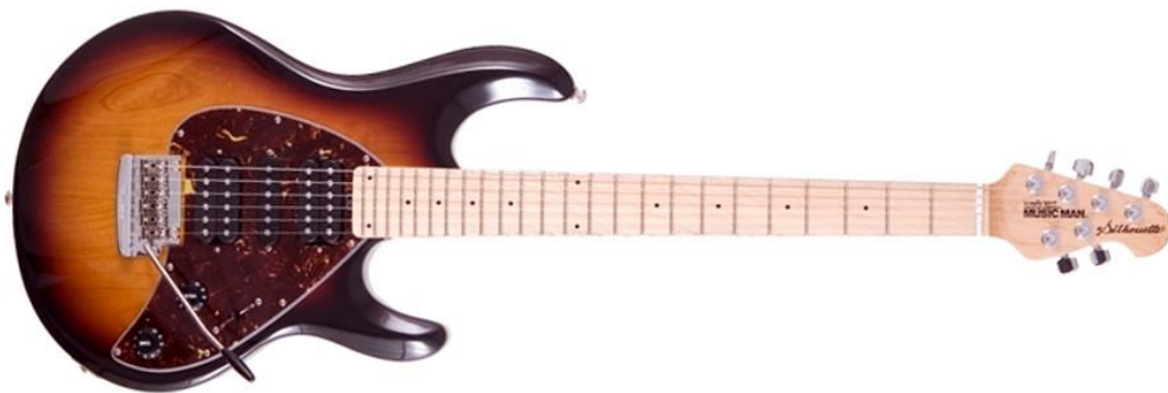
Obr. 6 Music Man