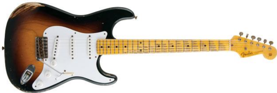
Obr. 4 Stratocaster