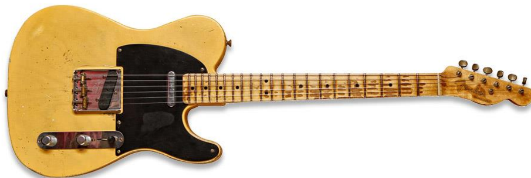
Obr. 2 Broadcaster

Během řešení sporu o jméno značky došlo k zajímavému efektu. Některé přechodné unikátní modely známé jako „No – Castery“ neměly na hlavici vůbec žádné pojmenování. Dnes jsou tyto kusy velice vzácné, patrně bychom je našli ve vlastnictví nějakého sběratele.