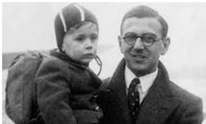
obr. č. 1 Nicholas Winton při záchraně dětí

Nicholase Wintona za statečnost a záchranu skoro 700 dětí vyznamenala královna Alžběta II., povýšila ho do šlechtického stavu, získal i Řád Britského impéria. Vyznamenání převzal nejen z rukou prezidentů Václava Havla a Václava Klause, ale také od prezidentů dalších zemí. Sir Nicholas Winton zemřel 1. července 2015 ve věku 106 let.