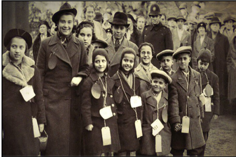
obr. č. 4 transport dětí z Prahy