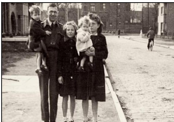
obr. č. 3 Nicholas Winton s dětmi

Měl opustit Prahu 1. září 1939, na nádraží bylo připraveno k odjezdu 251 dětí, v Londýně na ně čekalo 251 rodin. Ale vlak se nerozjel. Toho dne vypukla 2. světová válka a většina z 251 dětí, které měly vlakem odjet, zahynula v koncentračních táborech. Winton později litoval: „Kdyby ten vlak odjel o den dříve, mohl by dorazit do cíle.“ Tragický osud dětí z posledního vlaku označil za jednu z nejsmutnějších věcí svého života.