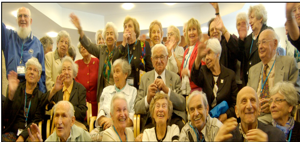
obr. č. 8 setkání Nicholase s jeho „dětmi“