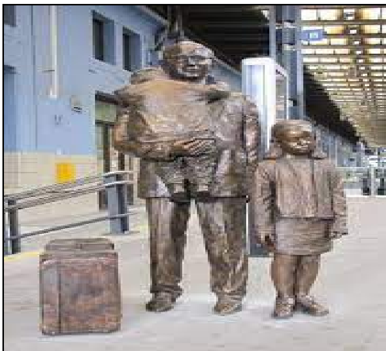
obr. č. 10 sousoší na hlavní nádraží v Praze