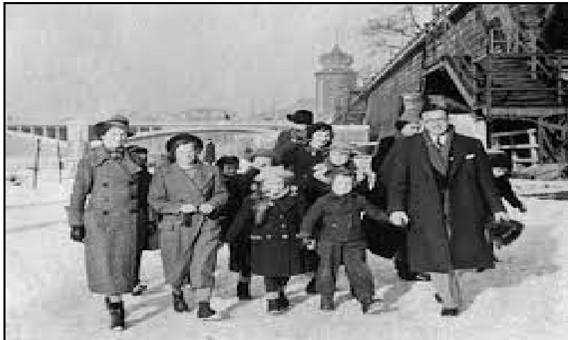
obr. č. 5 Nicholas Winton s dětmi na nábřeží v Praze