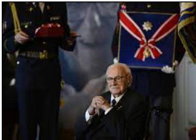
obr. č. 9 ocenění Nicholase v Praze

„S medailemi nemůžete nic dělat. Můžete si je leda připnout na pyžamo a nosit je i v noci, ale jinak jsou prakticky k ničemu. Nikdy jsem žádný z řádů nenosil.“