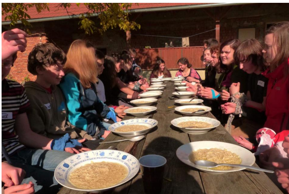
Obr. č. 1 – Účastníci prvního víkendu RacKa před obědem

schůzku, uskutečnit ji, zapsat, co se tam dělo a proč, a na dalším víkendu o tom všem říct. Na druhém víkendu jsou rozděleni do skupin cca po pěti lidech a v nich mají připravit nějakou akci pro určenou skupinu (skautky, skauti, vlčata, světlušky), kterou musí také zrealizovat. Na třetím víkendu diskutují o své práci a poznatcích. Poslední víkend je zakončen slavnostním obnovením skautského slibu a předáním nášivek a triček dokládající absolvování kurzu. Potom mají všichni účastníci dohromady uspořádat „afterparty“ jako poděkování vedení a zároveň pro všechny příjemné zakončení RacKa.