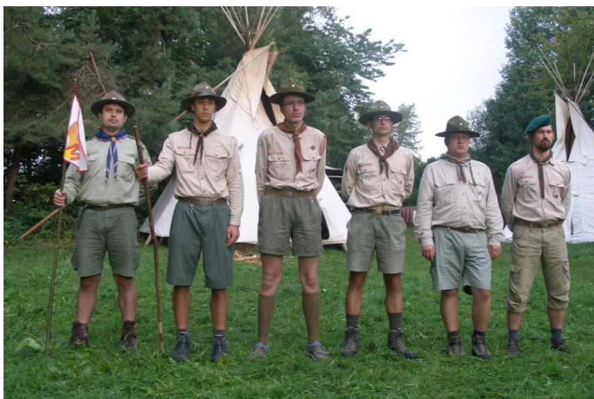
Obr. č. 3 - Nástup na letní části JeLŠ 2008