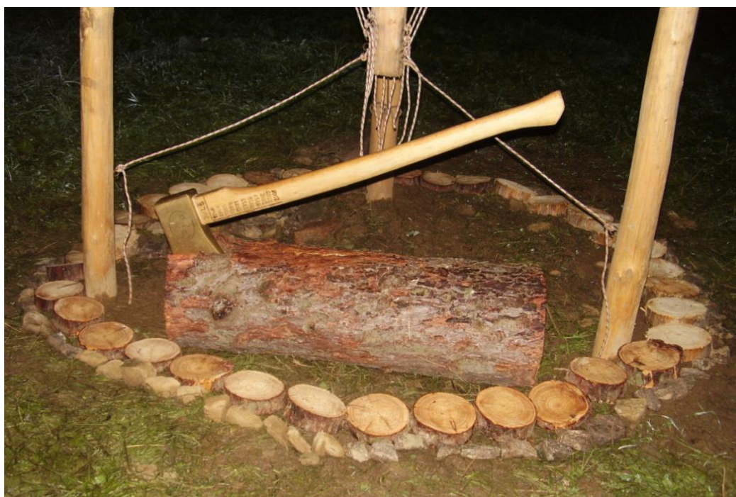
Obr. č. 5 – Obřadní sekera JLŠ 2016