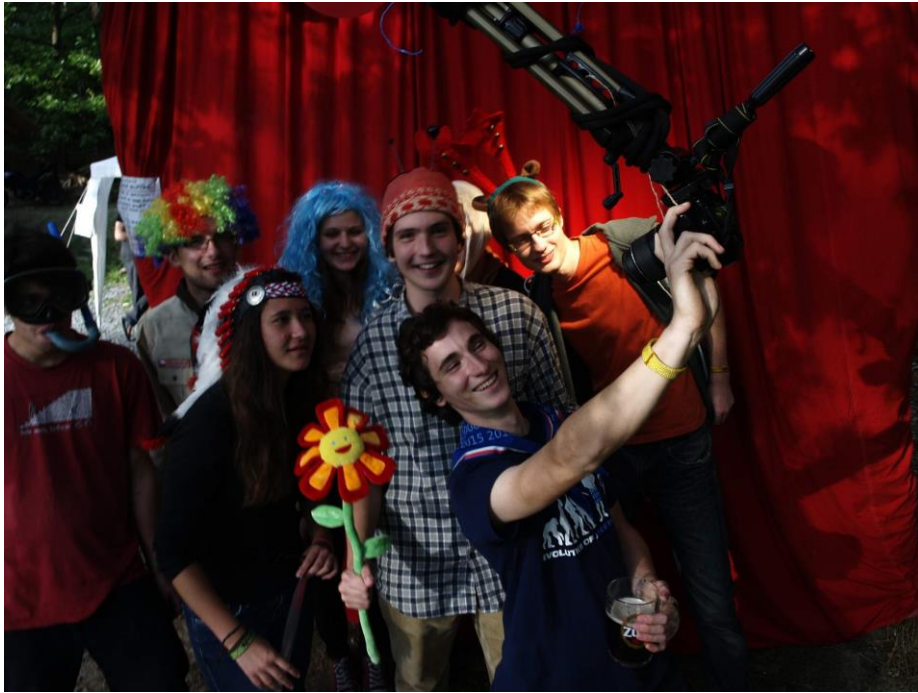
Obr. č. 6 – Fotící se někteří účastníci RFORfestu