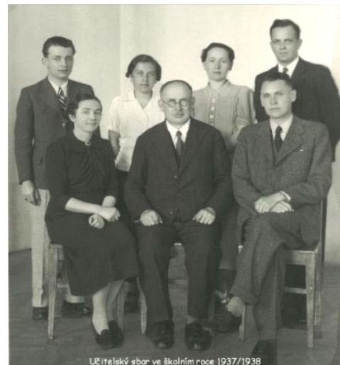
Učitelský sbor ve školním roce 1937/1938

Učitelský sbor se obyejně skládá z matykáře, latináře, chemika, češtináře atd., což jsou názvy obecně známé, pročež uvádíme místo nich jiná rozdělení, méně běžná.