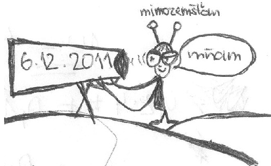
Mimozemšťan Mňam aneb bojte se 6. 12. 2011