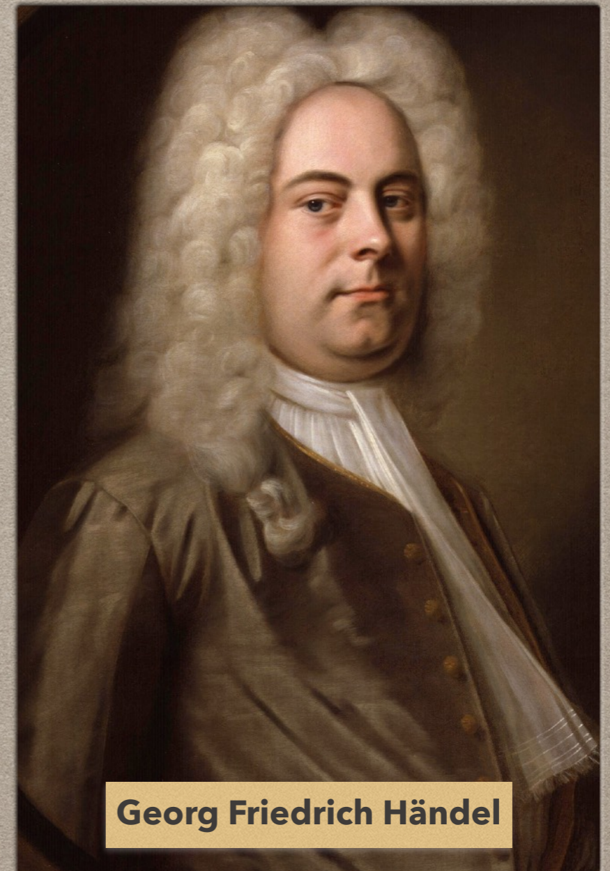
Georg Friedrich Händel